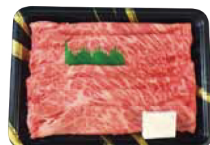
22. 神戸牛乃匠 神戸ビーフすき焼

税込 10,800円 (本体価格 10,000円) 神戸ビーフステーキ(モモ)260g / 賞味期限: 冷凍30日 / 牛肉(兵庫県産) / 【牛肉】 ※冷凍便にてお届け