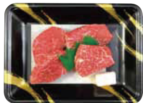
21. 神戸牛乃匠 神戸ビーフステーキ

世界が認めた芸術品。きめ細やかな霜降り、 とろける旨み、芳醇な香りが織りなす至福の味わいー神戸ビーフ。