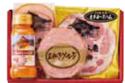
24. 三田屋本店ロースハム詰合せ

三田屋本店のハムをご自宅でお楽しみください! 三田屋本店定番のロースハムスライスとオリジナルドレッシング、さらにカタロースハム、玉ねぎソーセージを詰合せました。三田屋本店自慢のハムは、職人たちの確かな腕と目によって生まれた深みのある旨味、たゆまぬ努力によって磨き上げられた本物だけが持つ、豊かな味わい、伝統製法を守り続けている逸品です。