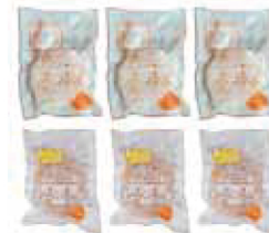
26. 淡路島ハンバーグ セレクトギフト

淡路島の自然が育てた淡路牛の上質な味わいと、えびすもち豚を合わせた奥行きのある旨み。異なる魅力を持つ二種のハンバーグを、贈り物としてふさわしい上品なセットに仕立てました。素材の持ち味を丁寧に生かした、食卓を豊かにするこだわりのギフトです。