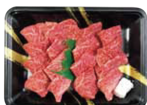
23. 神戸ビーフ 焼肉

税込 10,800円 (本体価格 10,000円) 神戸ビーフすき焼(肩ロース)300g / 賞味期限: 冷凍30日 / 牛肉(兵庫県産) / 【牛肉】 ※冷凍便にてお届け