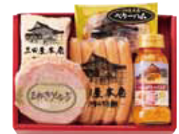
25. 三田屋本店ロースハム詰合せ

税込 3,780円 (本体価格 3,500円) ロースハムスライス60g、ハム用ドレッシング120ml、カタロースハム80g、玉ねぎソーセージ120g / 賞味期限: 冷蔵30日 / 【卵・乳・小麦・牛肉・豚肉・大豆】 ※冷凍便にてお届け