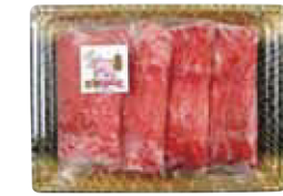
18. 京都ぽーく ロースしゃぶしゃぶ