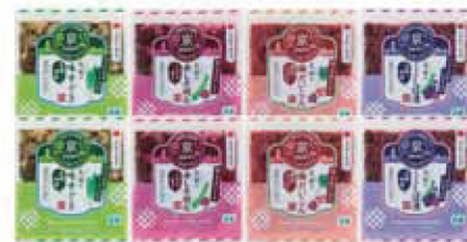
16. 創業120余年 京つけもの大安漬物詰合せ(8点入)

大安の味すぐき・大安の赤しそ胡瓜×各2、大安の梅だいのこ・大安のきざみしば漬×各1 (内容量:各60g) / 賞味期限: 製造日より常温270日 / 【小麦・大豆・りんご】