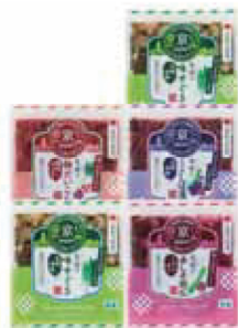
14. 創業120余年 京つけもの大安漬物詰合せ(5点入)

創業120余年、京つけもの大安が贈る京の味わい。すぐきの芳醇な酸味、赤しそ胡瓜の爽やかな香り、梅だいの上品な風味、きざみしば漬の深い旨味。伝統の技が織りなす、格別の美味をお届けします。