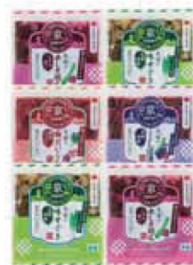
15. 創業120余年 京つけもの大安漬物詰合せ(6点入)

大安の味すぐき×2、大安の赤しそ胡瓜・大安の梅だいのこ・大安のきざみしば漬×各1 (内容量:各60g) / 賞味期限: 製造日より常温270日 / 【小麦・大豆・りんご】