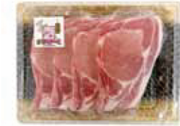
17. 京都ぽーく ロースステーキ

京都の穏やかな気候と清らかな地下水、そして生産者の丹精込めた飼育から生まれる「京都ぽーく」。その繊細な肉質と、ほんのり甘い上品な脂は、まさに「京の味わい」。旨みの余韻が広がる京都ぽーくを、特別なひとときの贈り物としてお届けします。