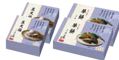
19. 京料理たん熊北店 豆大福・草餅

京都の名店「たん熊北店」監修。やわらかな白生地に小粒のえんどう豆がごろごろ入った素材の味が引き立つ豆大福と、よもぎが香るもち生地やさしい甘さの粒あんを包み込んだ草餅。国産素材にこだわった甘さを同時にお楽しみいただけます。